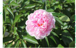
(花壇のシャクヤク)

学校では運動会を間近に控え、校舎中に元気いっぱい応援歌を歌う子供達の声が響き渡っています。6月4日(土)は、待ちに待った運動会です。感染予防のため、今年も午前中開催とし、参加は保護者のみで人数を制限した形で実施いたします。ご来賓の皆様、地域の皆様へのご案内は控えさせていただきます。規模を縮小しての開催となりますが、子供達の活躍をぜひご覧いただき、エールを送っていただきますよう、よろしくお願いいたします。