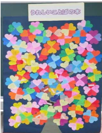
【うれしいことばの木】

今日は、みなさんが普段言っている「ことば」について、考えたいと思います。先日、友だちに言われてうれしい言葉、いやな言葉をカードに書いてもらいました。その時、みなさんには、その言葉に色があるとしたらどんな色かをイメージしながらカードを選んでもらいましたね。みなさんに書いてもらったカードを集めて、「うれしい言葉の木」「いやな言葉の木」を作ってみました。くらべてみてください。どんなことを感じますか?