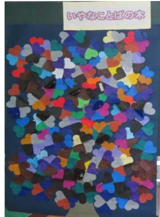
【いやなことばの木】

※子供達から…「うれしい言葉の木のほうがきれい」「うれしい言葉の木は、虹みたい。カラフルで明るい色」「いやな言葉の木は、暗い」「うれしい言葉はみんなが好きなお色、いやな言葉は嫌いな色」などの声があがりました。